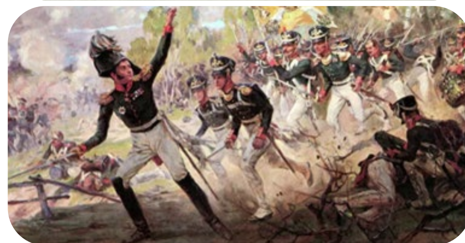
Благодарная память потомков

Увековечена в названии центральной улицы Омска (ныне — Красный Путь). В память о 7-й пехотной дивизии генерала П. М. Капцевича недалеко от Бородинского поля установлен памятник — часовня. Деятельности П. М. Капцевича посвящены научные исследования, подчеркивающие его вклад в развитие Омской крепости и защиту восточных рубежей России.