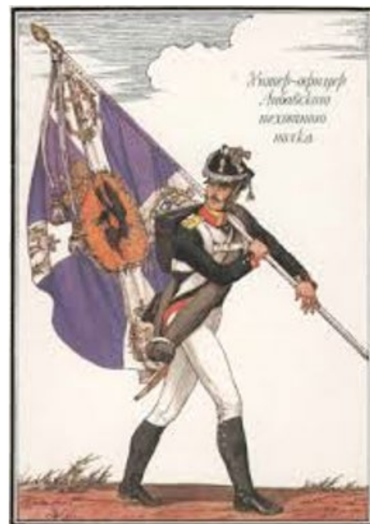
Роль в судьбе региона и страны